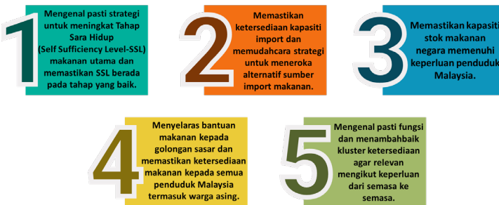
Rajah 2: Terma Rujukan Kluster Ketersediaan (KTS)